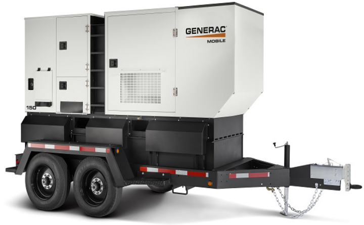
La imagen se usa solo con fines de ilustración